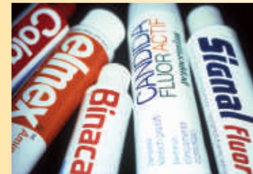
Mehr als 90 % der verkauften Zahnpasten enthalten Fluorid.

Nach dem Zähnebürsten ausspucken, aber nicht mit Wasser spülen; so erreicht man eine noch bessere Wirkung der Zahnpasta.