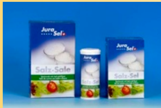
Fluoridiertes und jodiertes Speisesalz