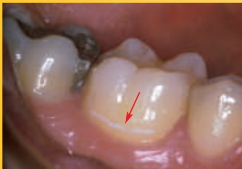
Dank Fluorid kann eine beginnende Karies gestoppt werden.